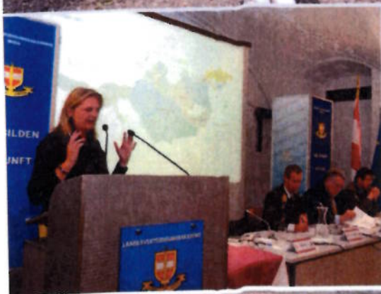
Vortrag von Dr. Karin KNEISSL „Der Nahe und Mittlere Osten im Umbruch“