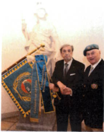
Überreichung eines Fahnenbandes zur Standarte der Vereinigung Österr. Peacekeeper