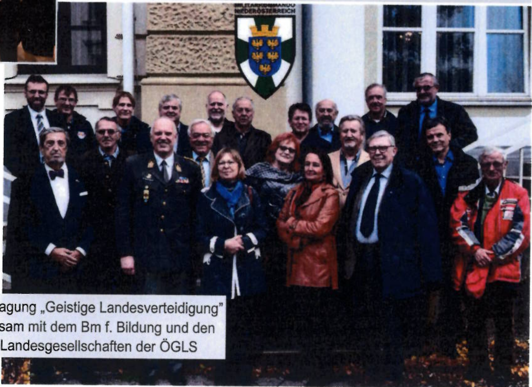
Jahrestagung „Geistige Landesverteidigung“ gemeinsam mit dem Bm f. Bildung und den GF der Landesgesellschaften der ÖGLS