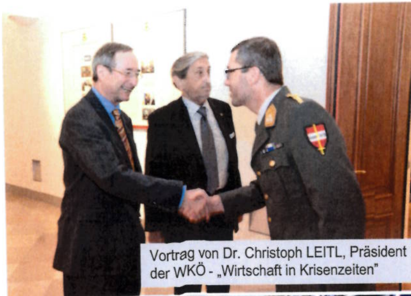
Vortrag von Dr. Christoph LEITL, Präsident der WKÖ - „Wirtschaft in Krisenzeiten“